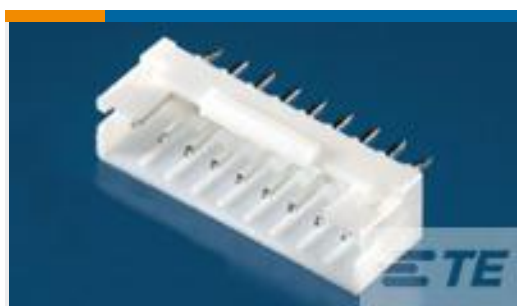
TE 产品编号 1-1735446-2 2MM PITCH HPI POST HEADER, VERTICAL, 12P