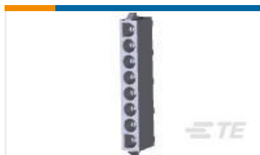
TE 产品编号643410-3 08P UMNL PIN HDR ASSY POL LF