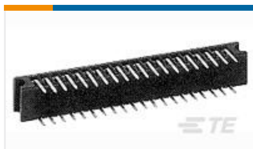
TE 产品编号5-532956-7 40 MODII 2PC CE RCPT ASSY, RoHS