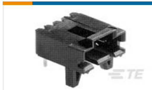
TE 产品编号6-103673-4 15 MTE HDR SRRA LATCH W/HLDWN