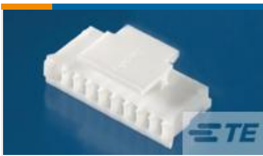
TE 产品编号 1-1735447-0 HPI 2.0 RECEPTACLE HOUSING, 10P