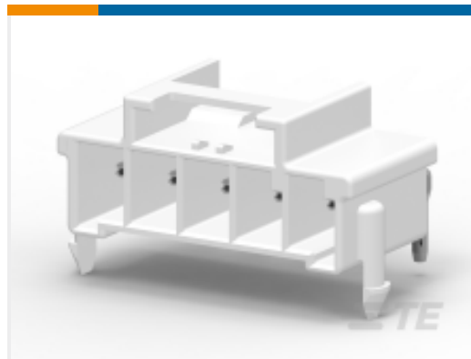
TE 产品编号1969694-5 PTL 1X5 PCB HEADER R/A STDTEMP KEY A NAT