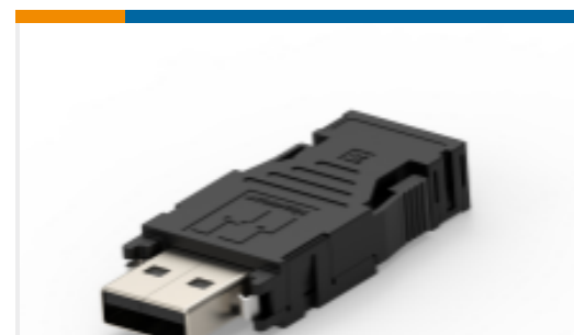
TE 产品编号 1827525-1 MECHATROLINK II CONNECTOR KIT