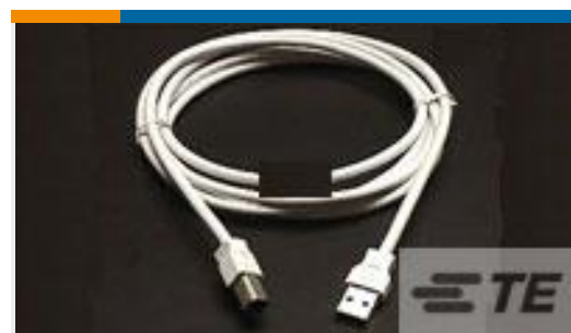
TE 产品编号 1487593-1 USB, A-BLUNT,28/24,WHT,2.0M