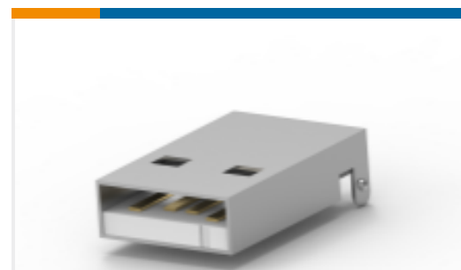
TE 产品编号 1-1734028-1 Std USB, Type A, Plug, Natural