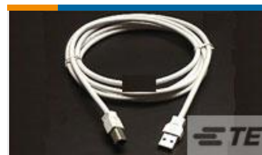
TE 产品编号 1487599-1 USB, A-BLUNT,28/28,BLK,0.83M