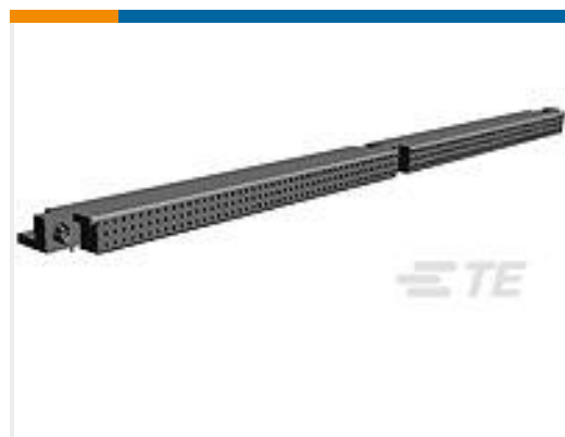
TE 产品编号5533514-6 ASSY,RECPT,R.ANGLE,HDI,LEAD-FR