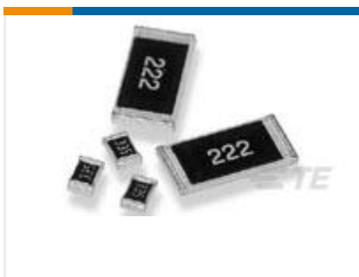
TE 产品编号3-2176067-2 CRG0201 1% 44R2