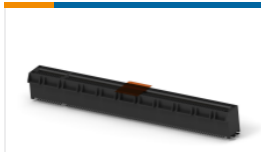
TE 产品编号 5-2337939-4 PCIE GEN4 CON,SMT,164POS,30u", MYLAR,HT