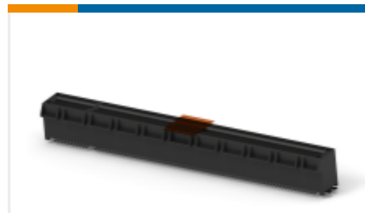
TE 产品编号 5-2337939-4 PCIE GEN4 CON,SMT,164POS,30u", MYLAR,HT