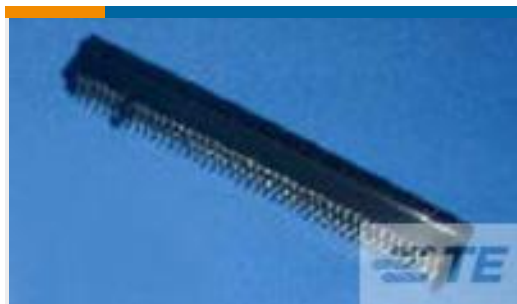
TE 产品编号 1734774-1 PCI EXP 3.1L 36 POS WHT G/F