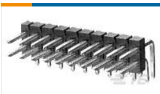
TE 产品编号2-826634-5 25P MODU 2 PIN HDR