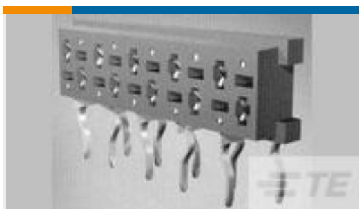
TE 产品编号1-100400-6 MICRO-MATCH FSID NP