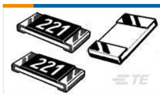
TE 产品编号2-2176230-2 3522 47R 5% 3W