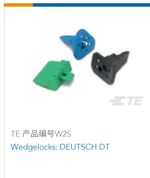
TE 产品编号W2S Wedgelocks: DEUTSCH DT