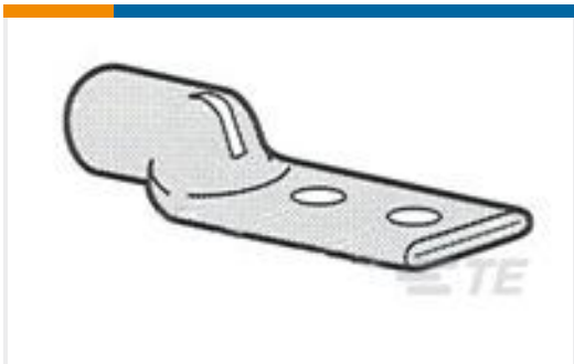
TE 产品编号55992-1 TERMINAL,AMPOWER R 2/0 5/16