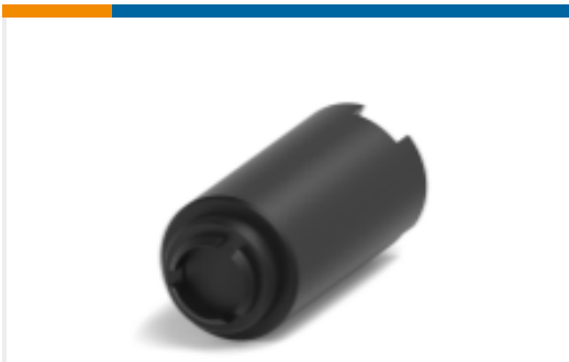
TE 产品编号YZ-KC-212751A-PY00 TOOL DISMOUNTING - FXP2