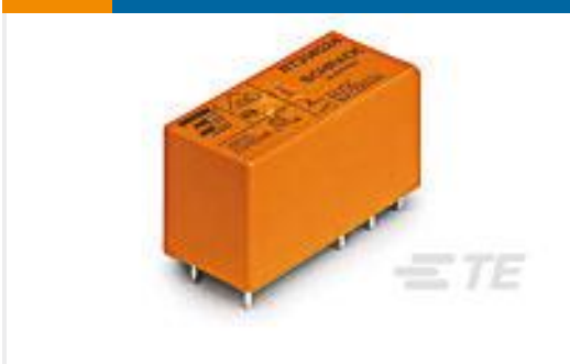
TE 产品编号1-1415543-5 RTE44110