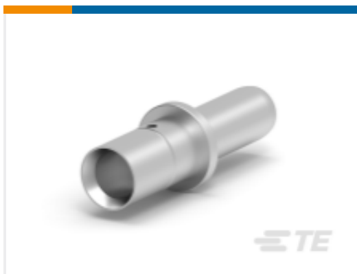
TE 产品编号SRK-PC-080-25-601 PIN, SOLID, SIZE M8, 25mm2, AG