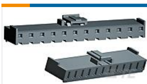
TE 产品编号1744036-3 03P ECONOMY POWER .200 CL HSG