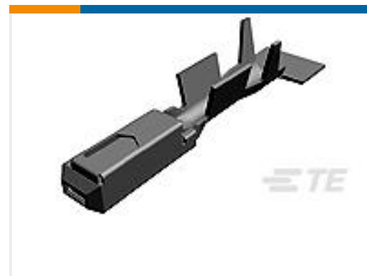
TE 产品编号1452158-1 MQS1,5 Sn rec CB unseal. 0,35-0,5