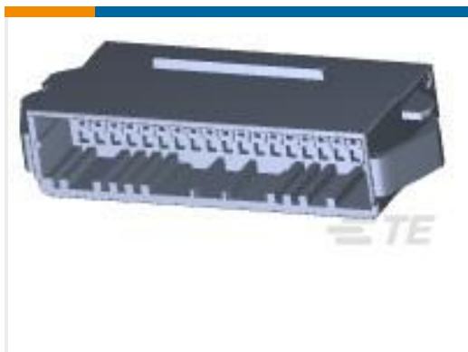
TE 产品编号1-1903128-0 DYNAMIC 1100D TAB HSG 40P P/M