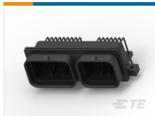
TE 产品编号6473427-1 SUPER SEAL 60POS CAP ASSY H AU