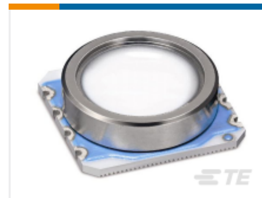
TE 产品编号MS580301BA01-00 MS5803-01BA01 PRESSURE SENSOR TUBE