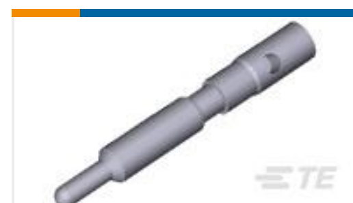
TE 产品编号193841-1 PIN, 2MM, 12-14 AWG