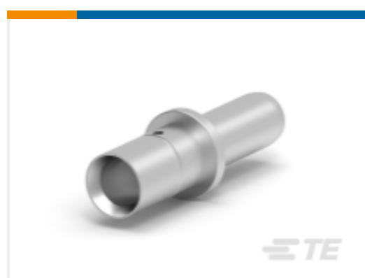
TE 产品编号SRK-PC-080-25-601 PIN, SOLID, SIZE M8, 25mm2, AG