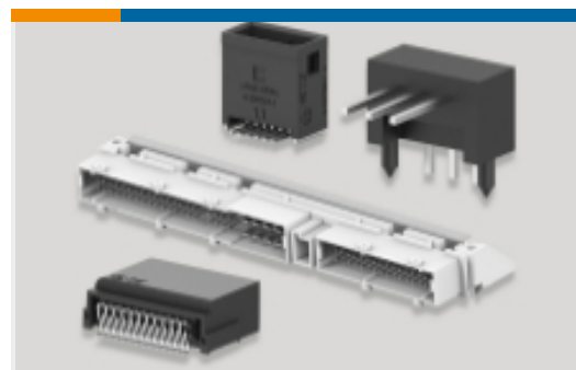
PCB 板端连接器及母端(3)