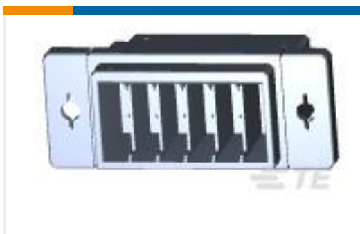
TE 产品编号917241-6 DYNAMIC D-3500 WTW TAB HSG 12P