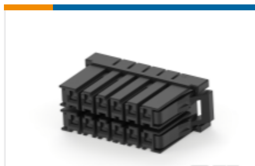
TE 产品编号1-179554-3 Receptacle and Tab Housing: 5.08 mm Pitch, 250-600V