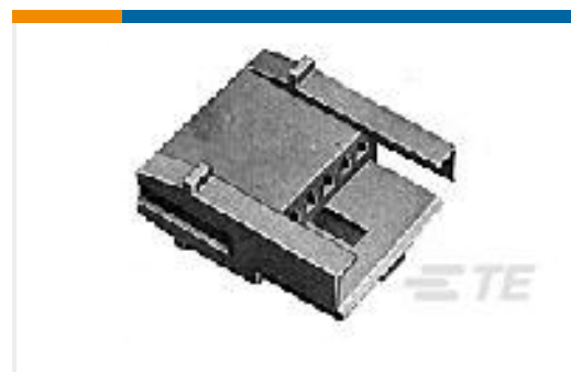
TE 产品编号172211-2 EIS CAP HSG FREE HANG 2P NATURAL