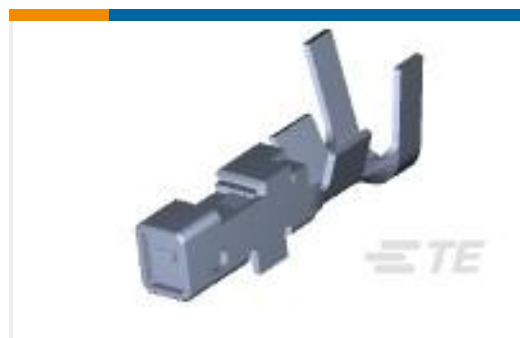
TE 产品编号1827571-2 DYNAMIC D1000 REC CONT L AU 0.38 um FORM