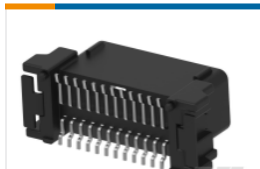
TE 产品编号1717394-3 0.64 SMD 24POS CAP ASSY V TIN Tray