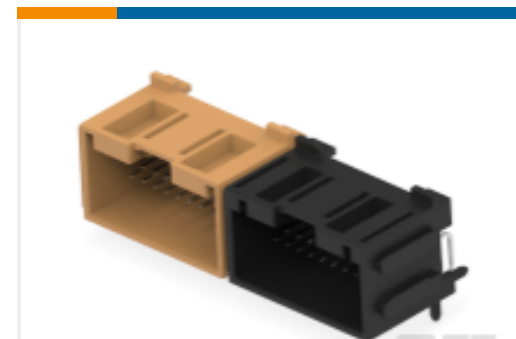
TE 产品编号2317779-3 40POS,TAB0.63X0.63,HDR ASSY, 90DEG,SLDR