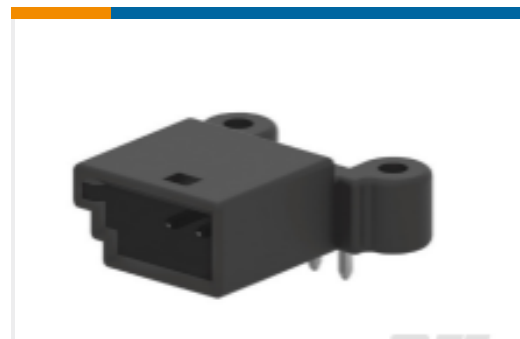
TE 产品编号1-1318853-3 Signal Header