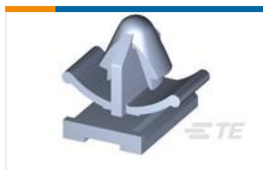
TE 产品编号368270-2 CLIP FOR 090III MLC SLOT TYPE