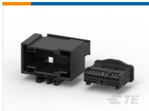
TE 产品编号1-1438608-5 MQS 连接器外壳