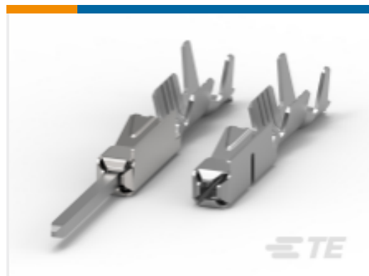
TE 产品编号5-963715-1 MQS, 母端和公端