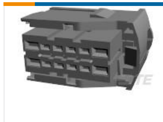
TE 产品编号284853-3 12 POS FEMALE CONNECTOR ASS'Y