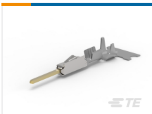
TE 产品编号7-965908-2 MQS0,63 Au tab LL EDS 0,5-0,75