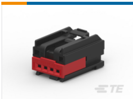
TE 产品编号1456985-3 1X6 Fem unsealed low profile assy Key C