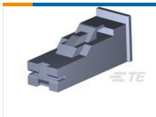
TE 产品编号281991-2 HSG FOR P-LOCK MK I TERM