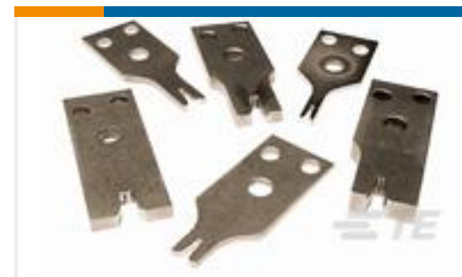
TE 产品编号1-456402-7 CRIMPER WIRE .055 F