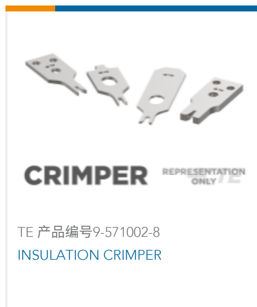
TE 产品编号9-571002-8 INSULATION CRIMPER