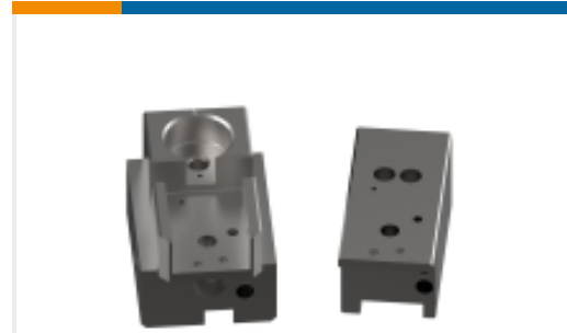
TE 产品编号2119057-1 GIB, RAM