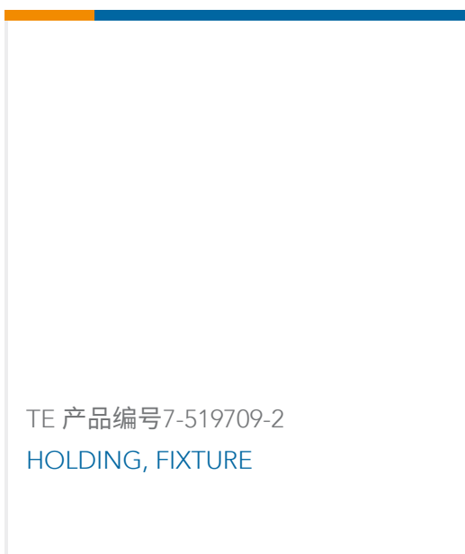
TE 产品编号7-519709-2 HOLDING, FIXTURE