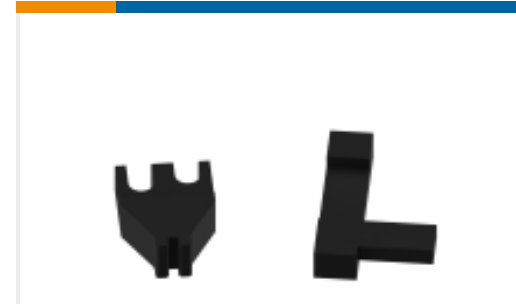
TE 产品编号2217529-1 HOLD DOWN, TERMINAL