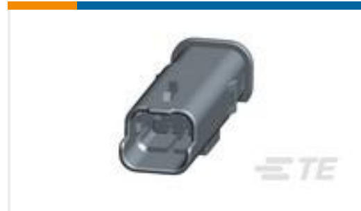
TE 产品编号1801174-4 2W TAB HP CONNECTOR YELLOW