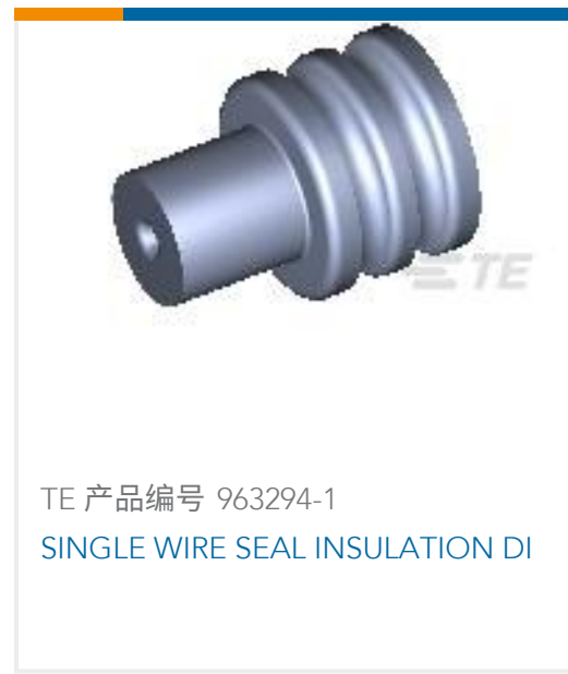
TE 产品编号 963294-1 SINGLE WIRE SEAL INSULATION DI