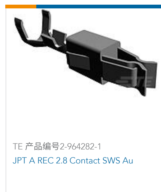
TE 产品编号2-964282-1 JPT A REC 2.8 Contact SWS Au