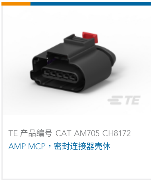
TE 产品编号 CAT-AM705-CH8172 AMP MCP, 密封连接器壳体