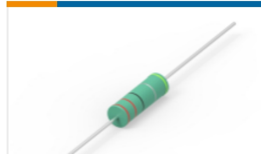
TE 产品编号8-2176613-1 EP 4W (SS) 2K2 5%