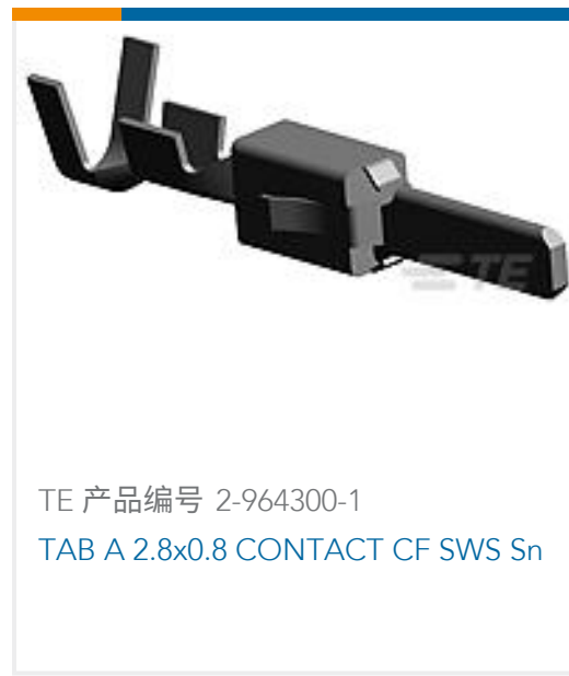
TE 产品编号 2-964300-1 TAB A 2.8x0.8 CONTACT CF SWS Sn