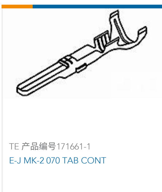
TE 产品编号171661-1 E-J MK-2 070 TAB CONT