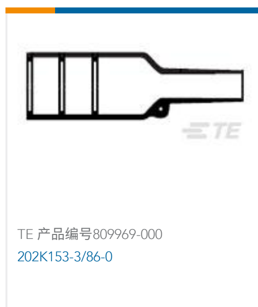
TE 产品编号809969-000 202K153-3/86-0