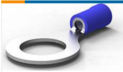
TE 产品编号160136 TERM, RING, PLASTI-GRIP, 16-14, M10