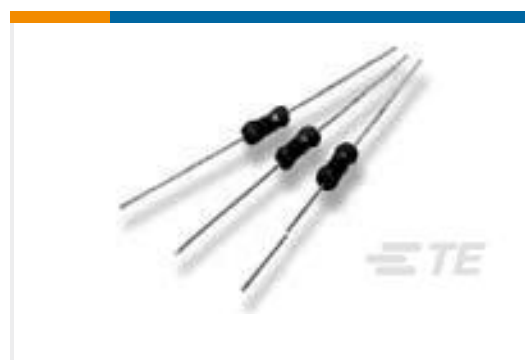
TE 产品编号4-1625892-3 3W SM M/OX 5% 33R