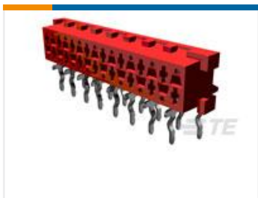
TE 产品编号215460-8 MICRO-MATCH FEM.SE