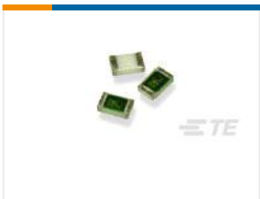
TE 产品编号6-1879208-3 CPF 0402 3K9 0.1% 25PPM 1K RL