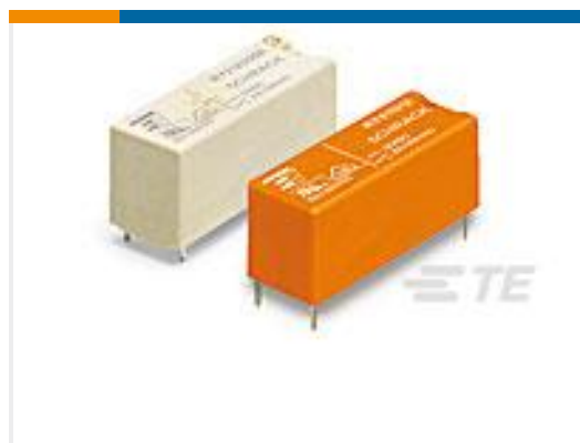
TE 产品编号1-1956170-6 RY211012R