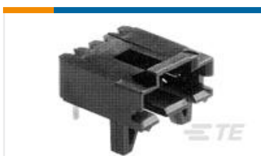
TE 产品编号5-103672-9 10 MTE HDR SRRA LATCH W/HLDWN