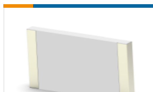
TE 产品编号2176246-8 CRGS2512 5% 3R9