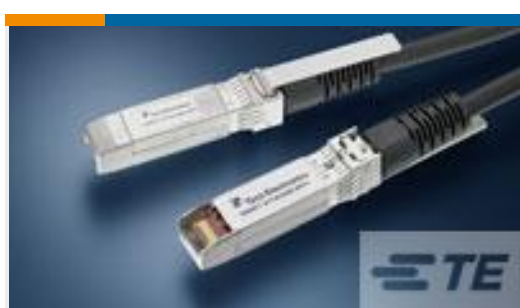
TE 产品编号2127931-1 C/A, SFP+, GENERIC, 0.5M