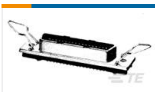
TE 产品编号5406874-1 ASSY,RCPT,50POS,SHD,LPF,V/MTG