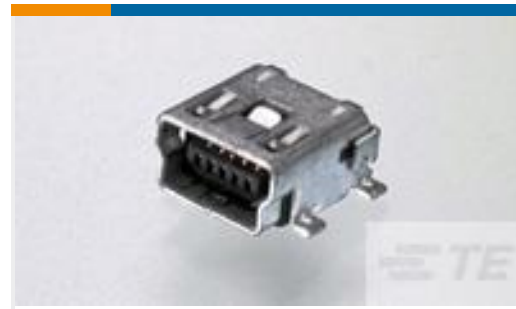
TE 产品编号1-1734035-2 MINI USB, TYPE B, R/A, SMT