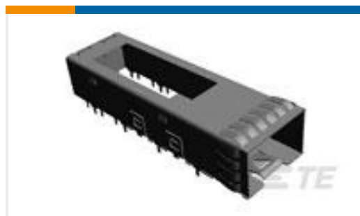
TE 产品编号2110304-1 SFP+ 1x1 Cage Assembly, Solder Tail