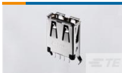
TE 产品编号1734366-3 Std USB Type A, VT, T/H, Blue