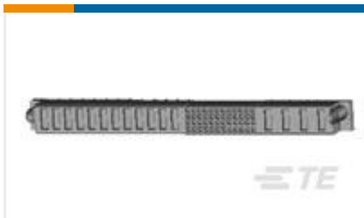
TE 产品编号6450863-5 MBXLE VERT RCPT 7ACP