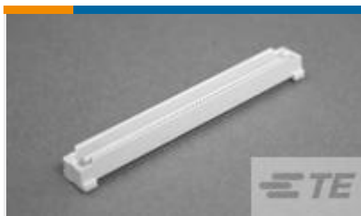
TE 产品编号5177984-6 0.8FH,P05H.5,140,08/Sn,TU