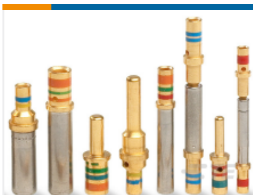
TE 产品编号ZPF00000000001233 097-0165-12