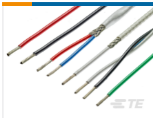
TE 产品编号3643333001 100G0121-0.60-9/9