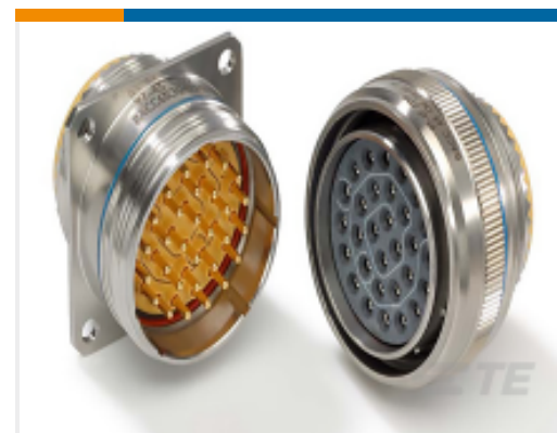
TE 产品编号ZPF000000000036945 983-6SE 14-04 SN-L