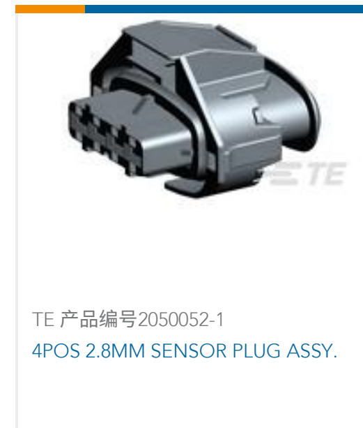
TE 产品编号2050052-1 4POS 2.8MM SENSOR PLUG ASSY.