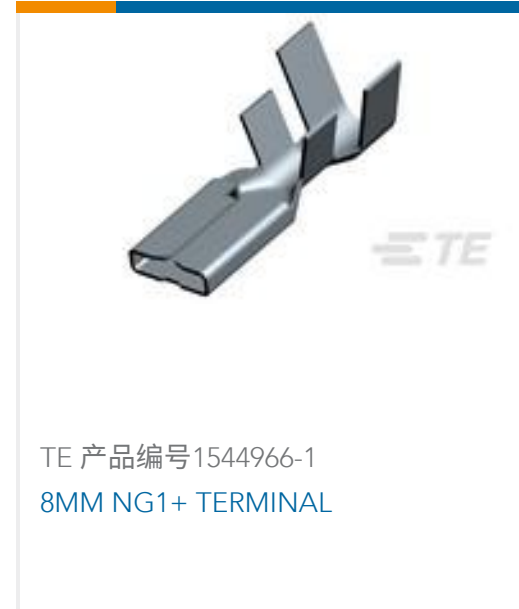
TE 产品编号1544966-1 8MM NG1+ TERMINAL