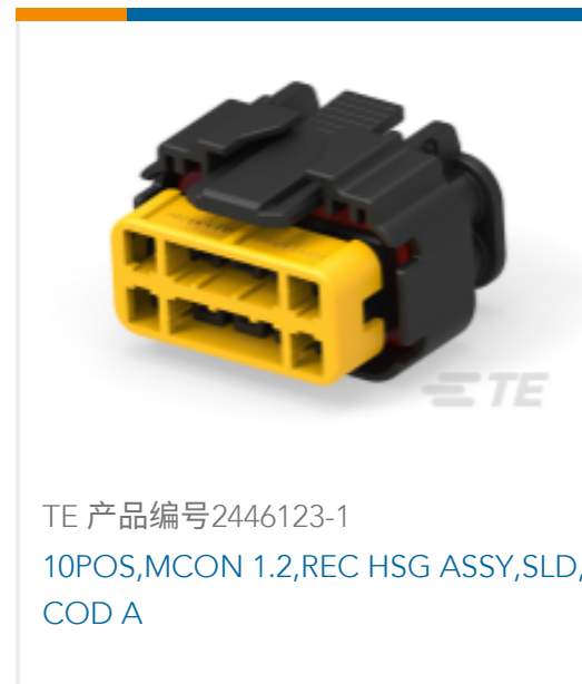
TE 产品编号2446123-1 10POS, MCON 1.2, REC HSG ASSY, SLD, COD A