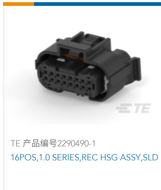
TE 产品编号2290490-1 16POS, 1.0 SERIES, REC HSG ASSY, SLD