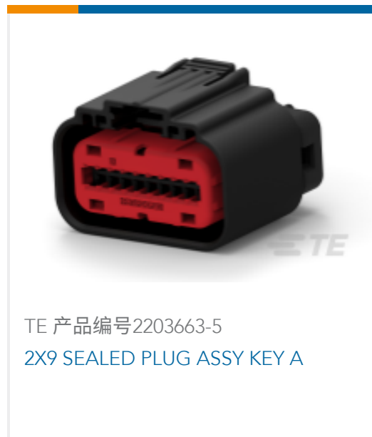
TE 产品编号2203663-5 2X9 SEALED PLUG ASSY KEY A