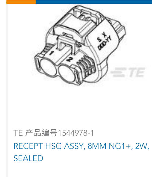
TE 产品编号1544978-1 RECEPT HSG ASSY, 8MM NG1+, 2W, SEALED