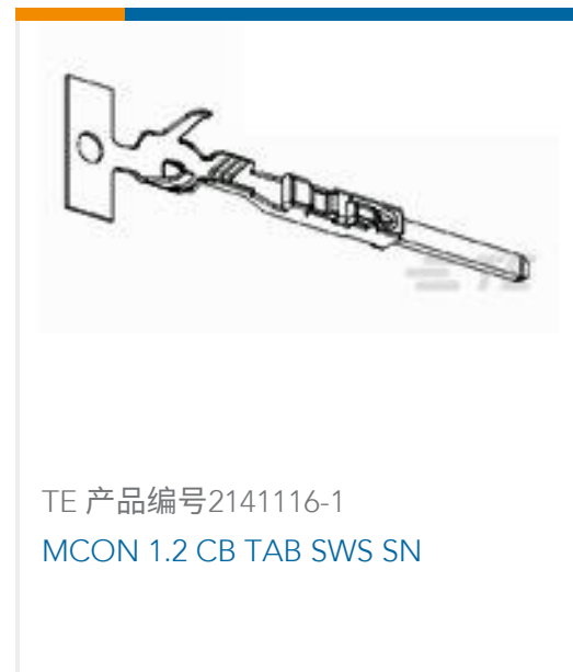
TE 产品编号2141116-1 MCON 1.2 CB TAB SWS SN