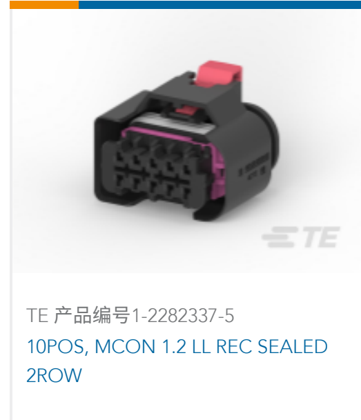
TE 产品编号1-2282337-5 10POS, MCON 1.2 LL REC SEALED 2ROW