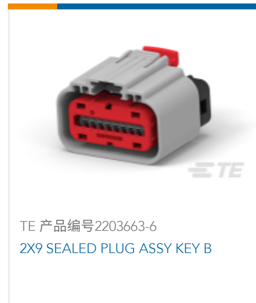
TE 产品编号2203663-6 2X9 SEALED PLUG ASSY KEY B