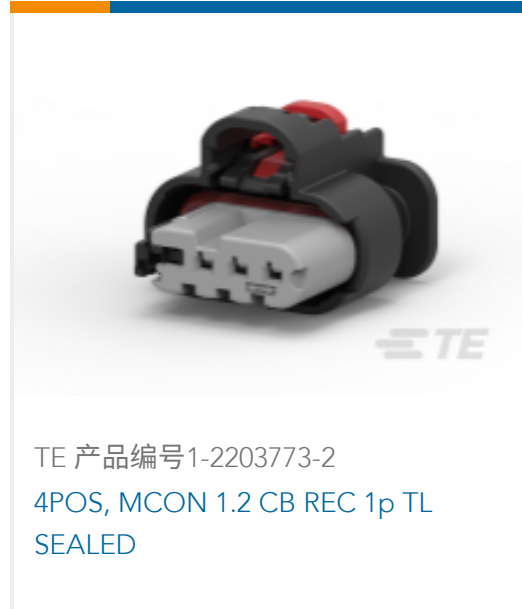
TE 产品编号1-2203773-2 4POS, MCON 1.2 CB REC 1p TL SEALED