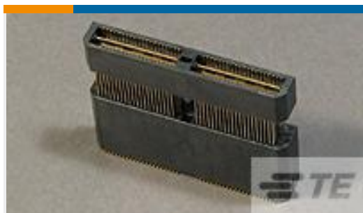
TE 产品编号 1-1658470-2 MSB0.80PL30ASY56DP,-,30,VCTY