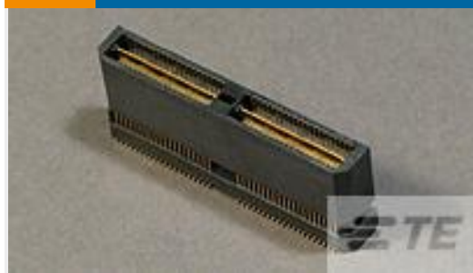
TE 产品编号 1-1658466-2 MSB0.80PL16ASY56DP,-,30,VCTY