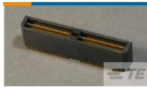
TE 产品编号 1-1658465-2 MSB0.80PL11ASY56DP,-,30,VCTY