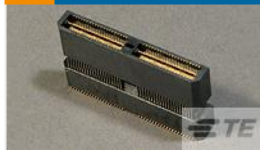
TE 产品编号 1-1658468-2 MSB0.80PL22ASY56DP,-,30,VCTY