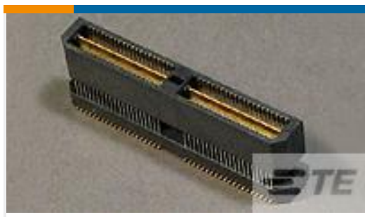
TE 产品编号 1-1658439-2 MSB0.80PL14ASY56DP,-,30,VCTY