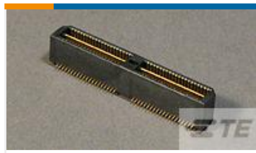
TE 产品编号 1-1658464-2 MSB0.80PL8ASY56DP,-,30,VCTY