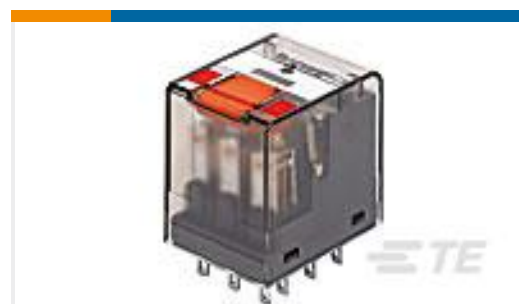
TE 产品编号3-1415020-1 PT570N20