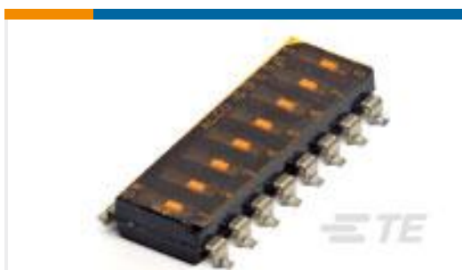
TE 产品编号1-1825006-9 GDS10S04=DIP SW,SLIDE,SMT