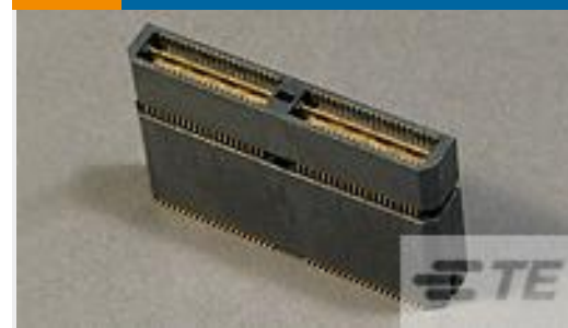
TE 产品编号 1-1658469-2 MSB0.80PL25ASY56DP,-,30,VCTY