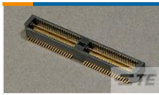
TE 产品编号 1-1658463-2 MSB0.80PL5ASY56DP,-,30,VCTY