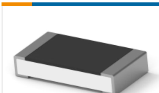
TE 产品编号4-2176391-7 RQ 1206 37K4 0.1% 10PPM 5K RL