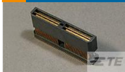
TE 产品编号 1-1658467-2 MSB0.80PL19ASY56DP,-,30,VCTY