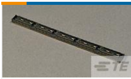
TE 产品编号 1-1658043-5 MSB0.80RC-ASY140DP,-,F,VCTY