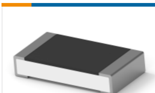
TE 产品编号4-2176391-7 RQ 1206 37K4 0.1% 10PPM 5K RL