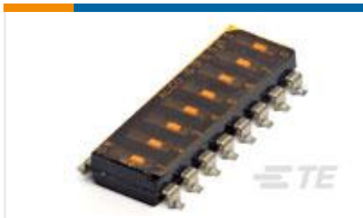
TE 产品编号1-1825006-9 GDS10S04=DIP SW,SLIDE,SMT