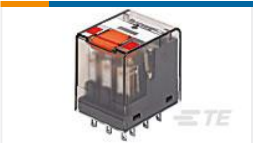
TE 产品编号3-1415020-1 PT570N20