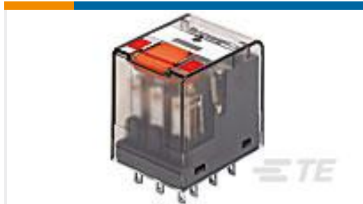
TE 产品编号3-1415020-1 PT570N20