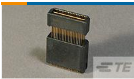
TE 产品编号 1-1658051-1 MSB0.80PL30ASY28DP,-,F,VCTY