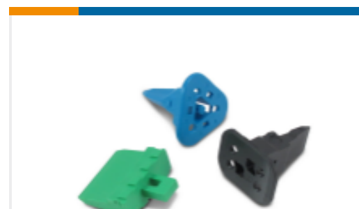
TE 产品编号W2S Wedgelocks: DEUTSCH DT