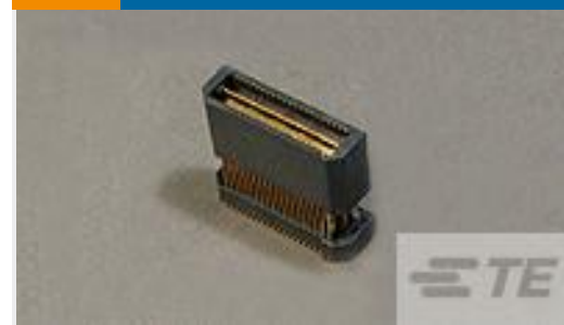
TE 产品编号 1-1658048-1 MSB0.80PL19ASY28DP,-,F,VCTY