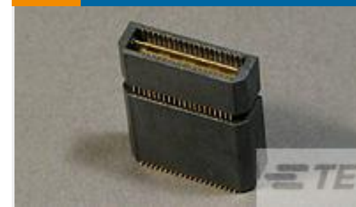
TE 产品编号 1-1658050-1 MSB0.80PL25ASY28DP,-,F,VCTY