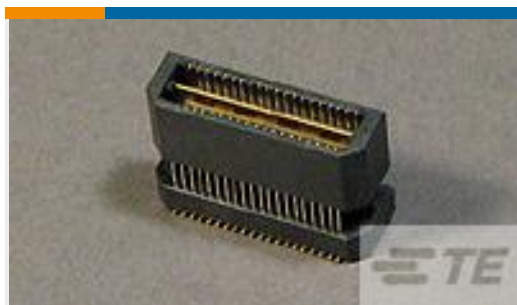
TE 产品编号 1-1658437-1 MSB0.80PL14ASY28DP,-,F,VCTY