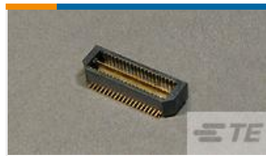
TE 产品编号 1-1658044-1 MSB0.80PL5ASY28DP,-,F,VCTY