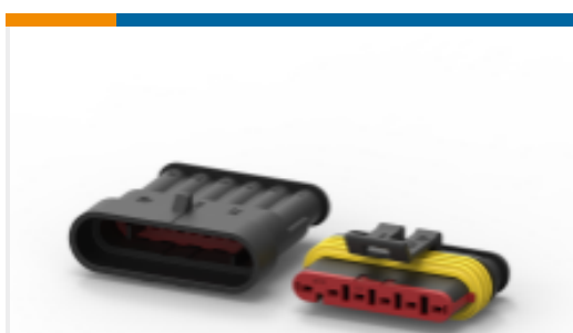
TE 产品编号282104-1 AMP SUPERSEAL 1.5MM, 连接器壳体