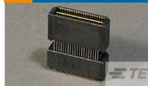
TE 产品编号 1-1658049-1 MSB0.80PL22ASY28DP,-,F,VCTY