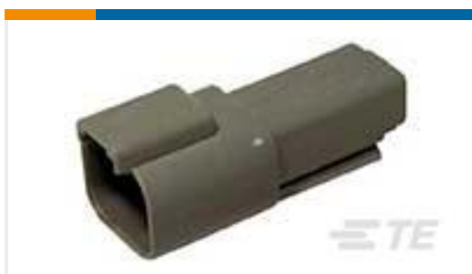
TE 产品编号DT04-2P REC, 2P, GRY, N