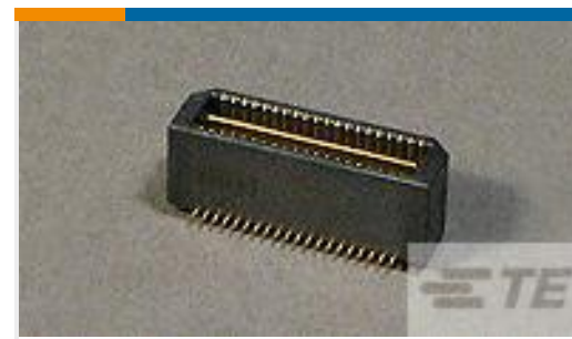
TE 产品编号 1-1658045-1 MSB0.80PL8ASY28DP,-,F,VCTY