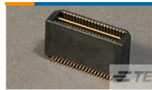
TE 产品编号 1-1658046-1 MSB0.80PL11ASY28DP,-,F,VCTY