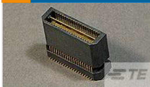
TE 产品编号 1-1658047-1 MSB0.80PL16ASY28DP,-,F,VCTY