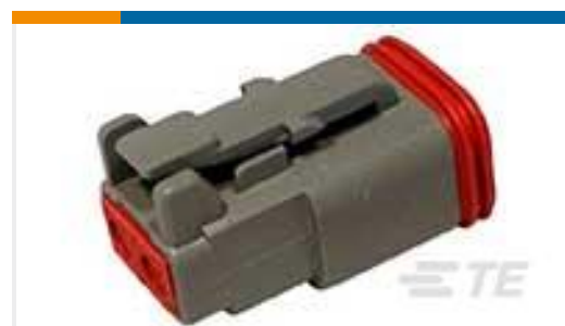
TE 产品编号DT06-2S PLG, 2P, GRY, N