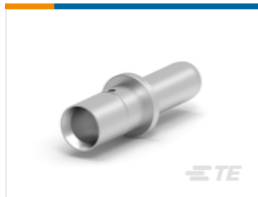
TE 产品编号SRK-PC-080-25-601 PIN, SOLID, SIZE M8, 25mm2, AG