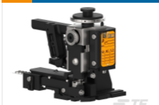
TE 产品编号2836244-1 OCEAN-2.0-APPLICATOR-S-090F155O-RSM