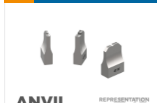
ANVIL REPRESENTATION ONLY