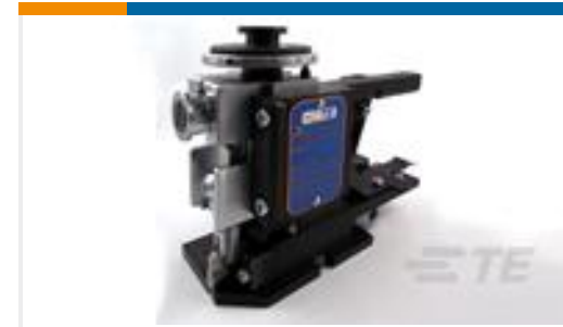
TE 产品编号2150258-1 OCEAN_2.0_Applicator-E-090F140F-REM