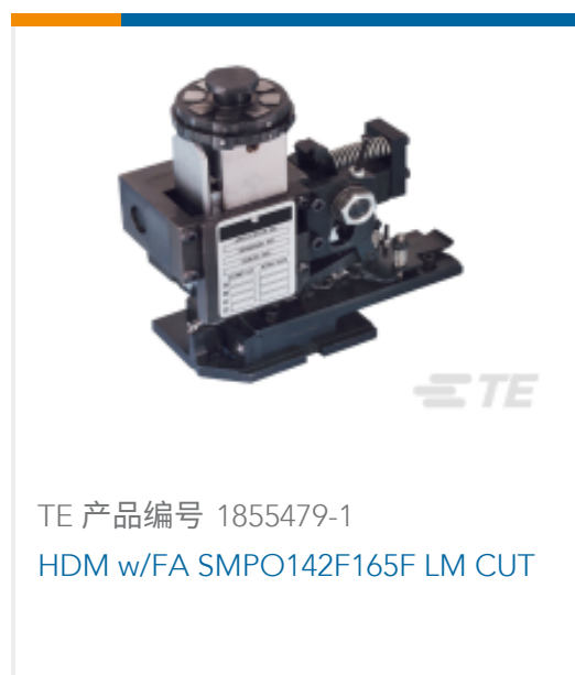
TE 产品编号 1855479-1 HDM w/FA SMPO142F165F LM CUT