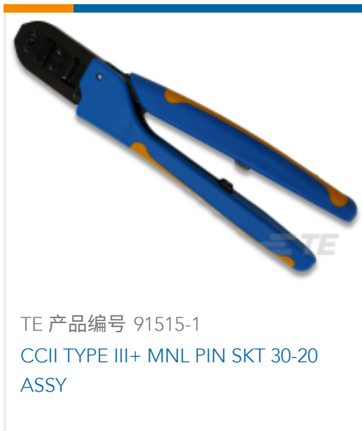
TE 产品编号 91515-1 CCII TYPE III+ MNL PIN SKT 30-20 ASSY