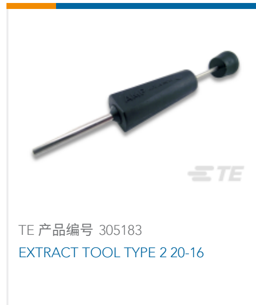
TE 产品编号 305183 EXTRACT TOOL TYPE 2 20-16