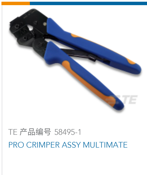
TE 产品编号 58495-1 PRO CRIMPER ASSY MULTIMATE