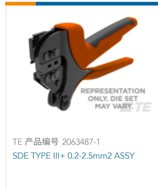
TE 产品编号 2063487-1 SDE TYPE III+ 0.2-2.5mm 2 ASSY