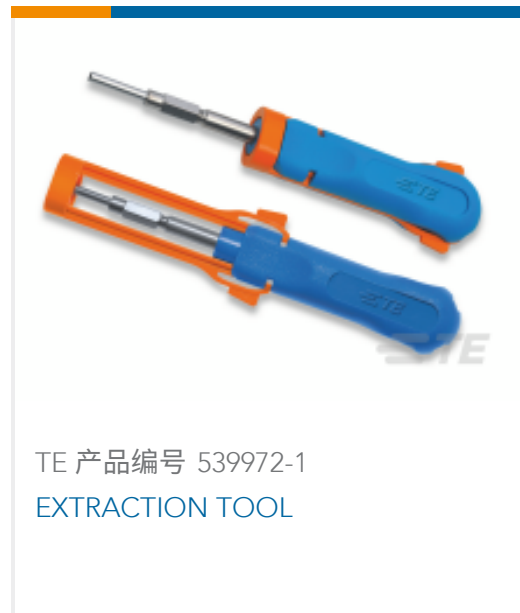
TE 产品编号 539972-1 EXTRACTION TOOL