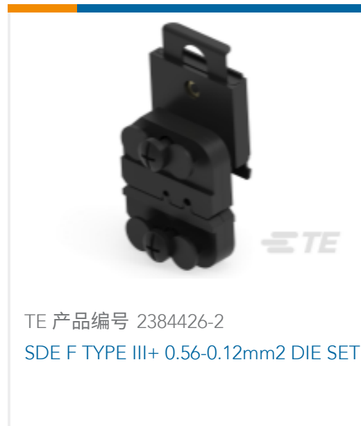
TE 产品编号 2384426-2 SDE F TYPE III+ 0.56-0.12mm 2 DIE SET