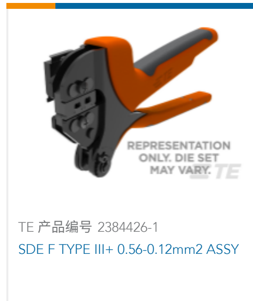
TE 产品编号 2384426-1 SDE F TYPE III+ 0.56-0.12mm 2 ASSY