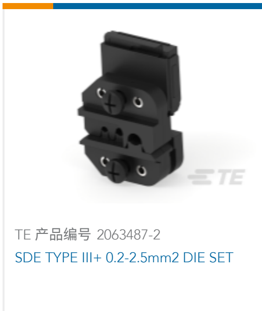
TE 产品编号 2063487-2 SDE TYPE III+ 0.2-2.5mm 2 DIE SET