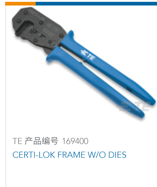
TE 产品编号 169400 CERTI-LOK FRAME W/O DIES