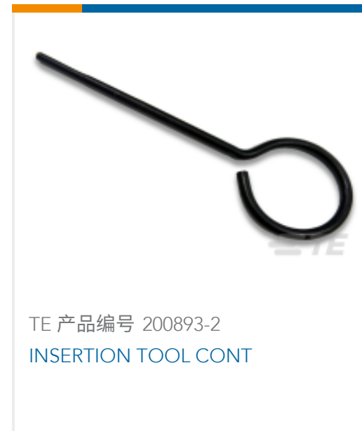
TE 产品编号 200893-2 INSERTION TOOL CONT