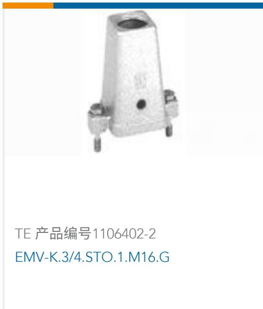
TE 产品编号1106402-2 EMV-K.3/4.STO.1.M16.G