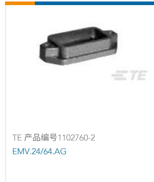
TE 产品编号1102760-2 EMV.24/64.AG