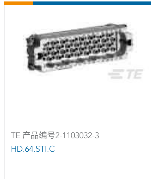
TE 产品编号2-1103032-3 HD.64.STI.C