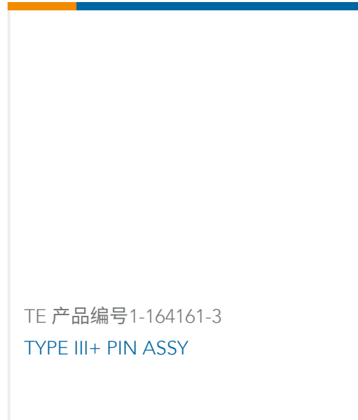
TE 产品编号1-164161-3 TYPE III+ PIN ASSY