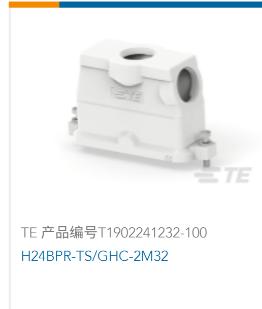
TE 产品编号T1902241232-100 H24BPR-TS/GHC-2M32