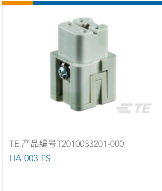
TE 产品编号T2010033201-000 HA-003-FS