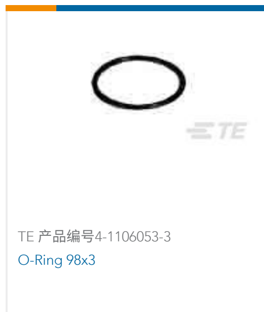
TE 产品编号4-1106053-3 O-Ring 98x3