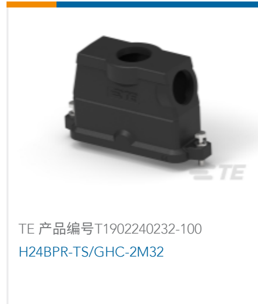
TE 产品编号T1902240232-100 H24BPR-TS/GHC-2M32