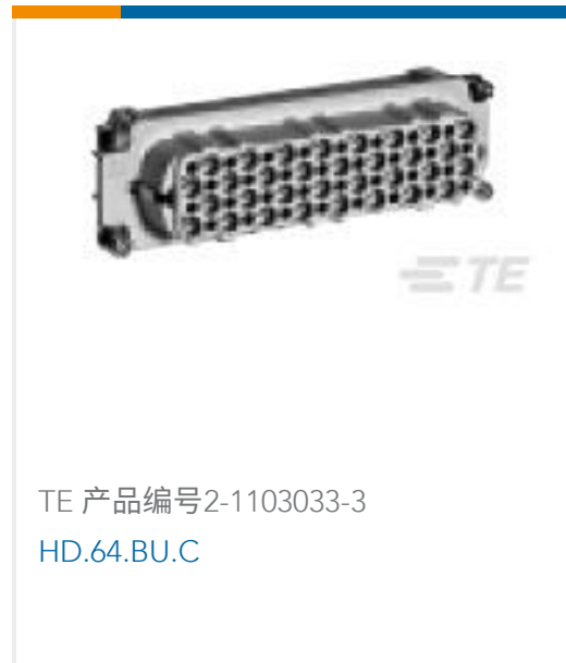
TE 产品编号2-1103033-3 HD.64.BU.C