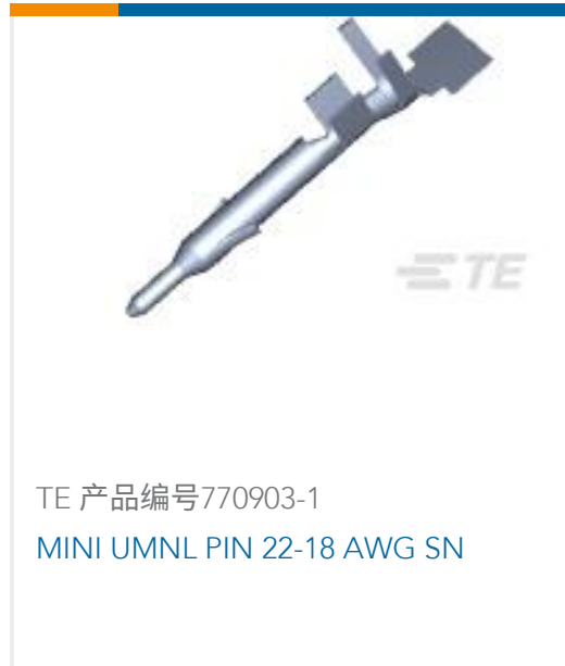
TE 产品编号770903-1 MINI UMNL PIN 22-18 AWG SN