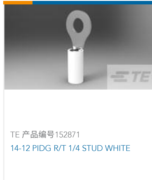
TE 产品编号152871 14-12 PIDG R/T 1/4 STUD WHITE