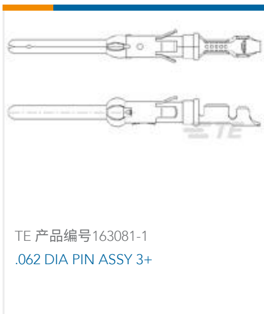
TE 产品编号163081-1 .062 DIA PIN ASSY 3+