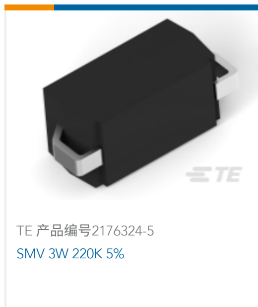
TE 产品编号2176324-5 SMV 3W 220K 5%