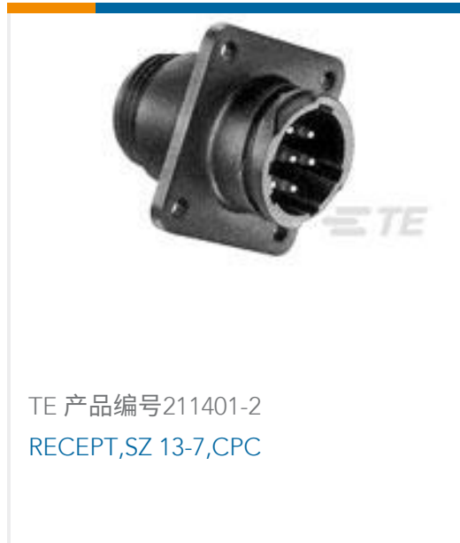
TE 产品编号211401-2 RECEPT,SZ 13-7,CPC