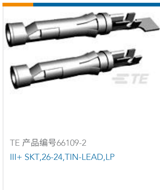
TE 产品编号66109-2 III+ SKT,26-24,TIN-LEAD,LP