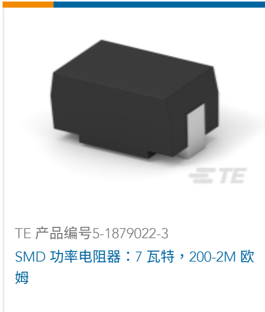
TE 产品编号5-1879022-3 SMD 功率电阻器：7 瓦特，200-2M 欧姆