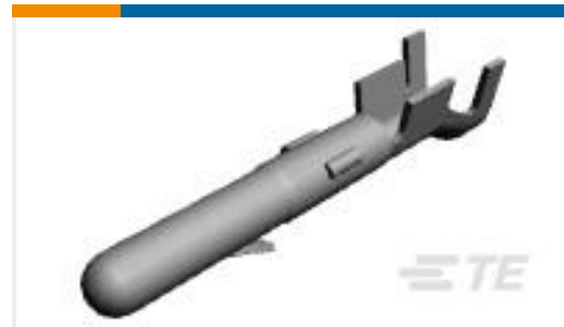
TE 产品编号163305-2 MATENLOK PIN SDW