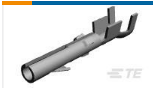
TE 产品编号163304-2 MATENLOK SOCKET SDW