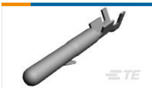
TE 产品编号163558-2 PIN M-N-L