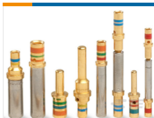
TE 产品编号ZPF000000000001880 174-0014-20