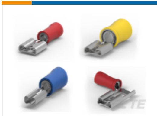
TE 产品编号640903-1 PIDG FASTON Receptacle Quick Disconnects