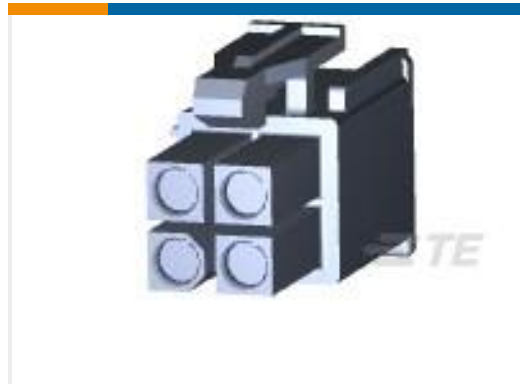
TE 产品编号172167-1 4 CIR UNIV M-N-L PLUG