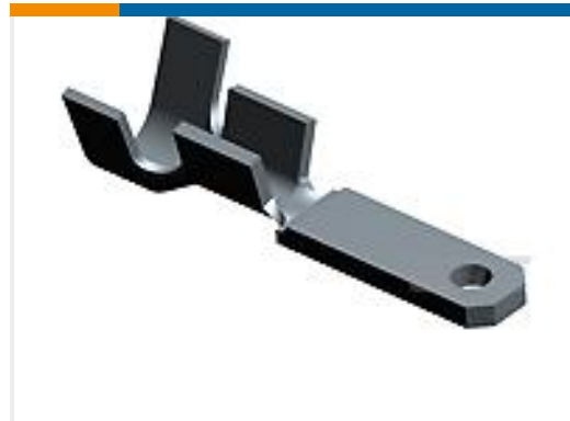
TE 产品编号63138-1 110 FASTON REC 22-18 AWG TPBR