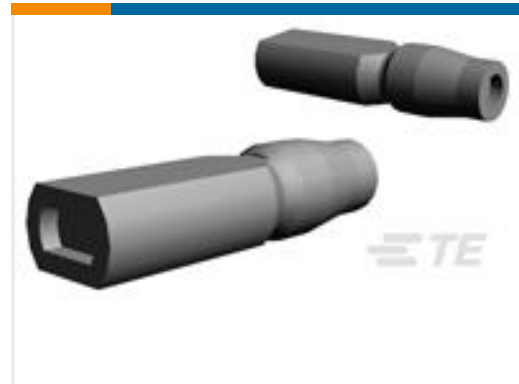
TE 产品编号1-1659321-0 H30013/5000