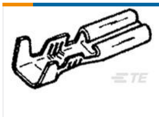
TE 产品编号1-1627081-0 H25031/R6000