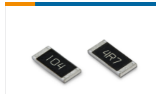
TE 产品编号2-2176455-5 CPF 0402 7R5 0.1% 25ppm 1K RL