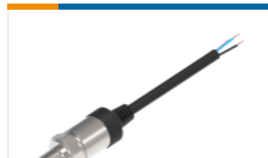
TE 产品编号20014203-12 PRESS XDCR M325M-000005-250PG