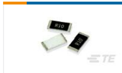
TE 产品编号2-1879461-5 RL73H 2A R13 1% 1K RL