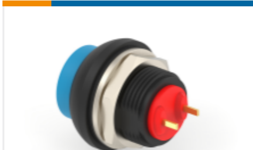
TE 产品编号2-2329328-0 PB OFF/ON HC BLU M4 TERM. IP68