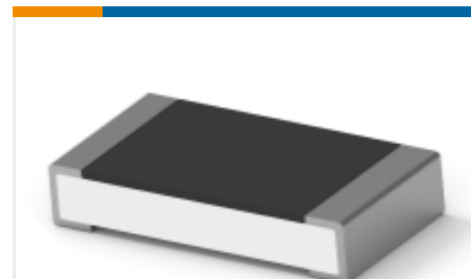
TE 产品编号1-2176391-0 RQ 1206 15K4 0.1% 10PPM 5K RL