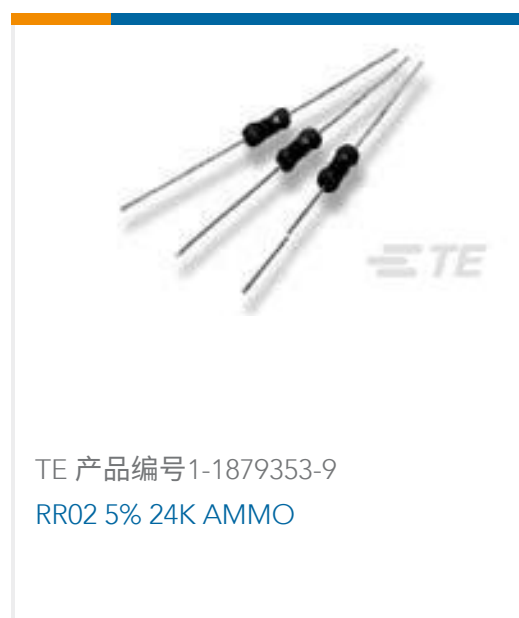
TE 产品编号1-1879353-9 RR02 5% 24K AMMO