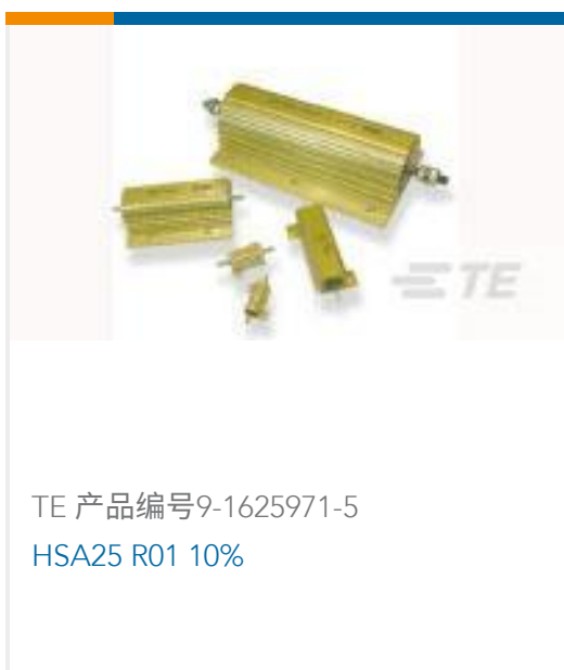
TE 产品编号9-1625971-5 HSA25 R01 10%