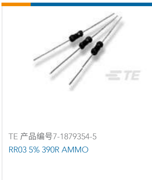
TE 产品编号7-1879354-5 RR03 5% 390R AMMO