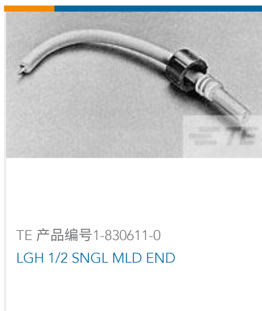
TE 产品编号1-830611-0 LGH 1/2 SNGL MLD END