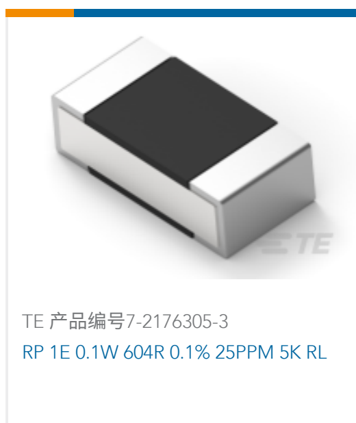
TE 产品编号7-2176305-3 RP 1E 0.1W 604R 0.1% 25PPM 5K RL