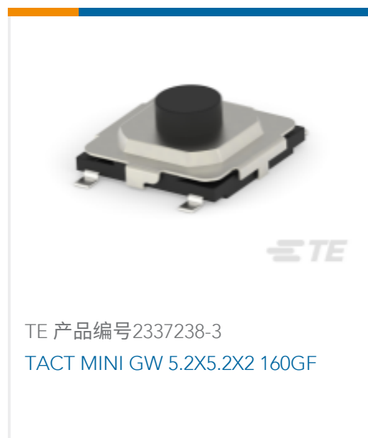
TE 产品编号2337238-3 TACT MINI GW 5.2X5.2X2 160GF