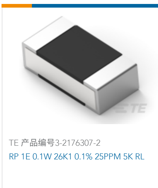
TE 产品编号3-2176307-2 RP 1E 0.1W 26K1 0.1% 25PPM 5K RL