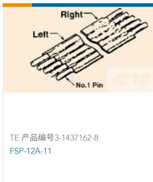
TE 产品编号3-1437162-8 FSP-12A-11