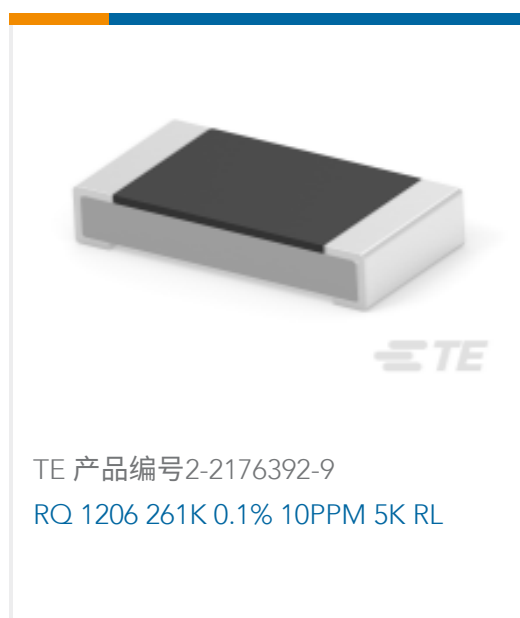
TE 产品编号2-2176392-9 RQ 1206 261K 0.1% 10PPM 5K RL