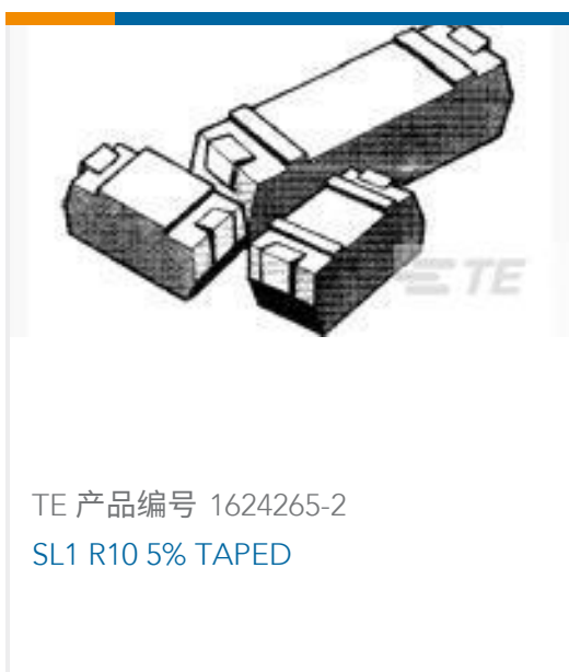
TE 产品编号 1624265-2 SL1 R10 5% TAPED