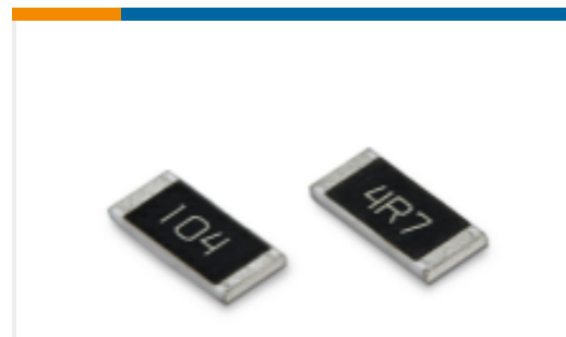
TE 产品编号2-2176455-5 CPF 0402 7R5 0.1% 25ppm 1K RL