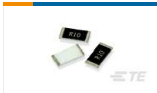
TE 产品编号2-1879461-5 RL73H 2A R13 1% 1K RL