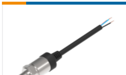
TE 产品编号20014203-12 PRESS XDCR M325M-000005-250PG