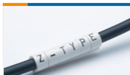
TE 产品编号EC0372-000 Z-Type Push-On Markers