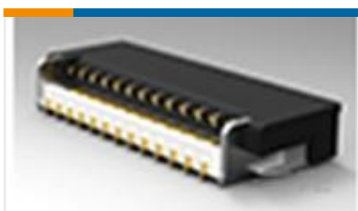
TE 产品编号1-2040832-8 EMBOSS TAPING 0.25FPC BF-L-1.3