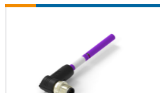
TE 产品编号TAB62246501-040 M12B2-MR-PUR TORSION-4.0M