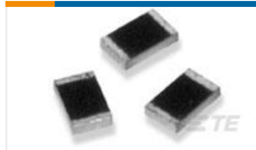
TE 产品编号9-1879253-4 RP 2B 22R1 0.1% 15PPM CUT LENGTH