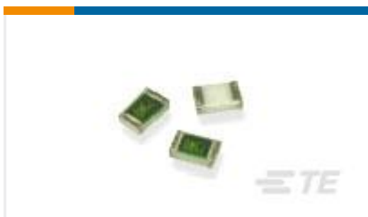
TE 产品编号1-2176093-1 RP 2A 0.25W 11K8 0.1% 25PPM 1K RL