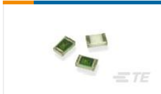
TE 产品编号2-2176091-1 RP 2A 0.25W 93R1 0.1% 25PPM 1K RL