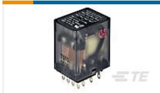
TE 产品编号4-1393122-4 KHAU-17D11-24=KH