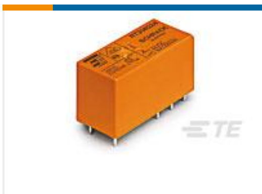
TE 产品编号 5-1393239-4 RT214012