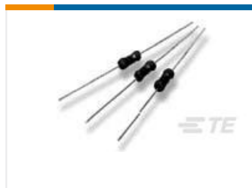
TE 产品编号 5-1625892-2 3W SM M/OX 5% 470R