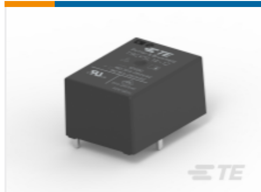
TE 产品编号 1558665-3 T9GS5L14-12