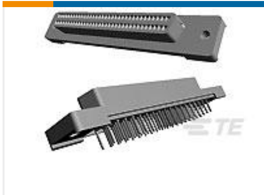
TE 产品编号 5749070-9 100 50SR VERT RCPT ASSY