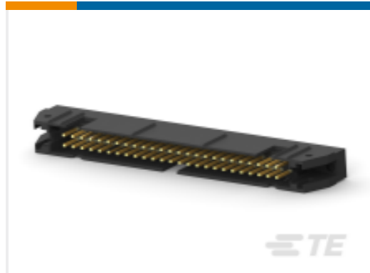
TE 产品编号 5499786-1 AMP 锁门通用插头