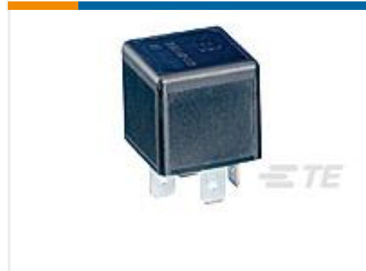
TE 产品编号 3-1393303-4 V23134B1052C642-EV-CBOX