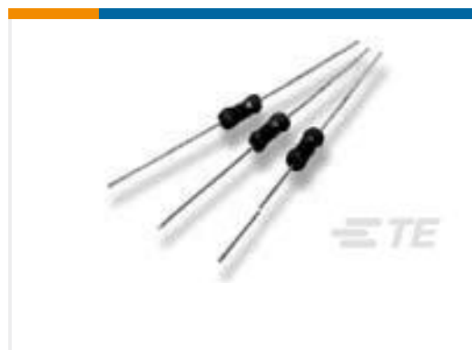
TE 产品编号 3-1625892-3 3W SM M/OX 5% 22R