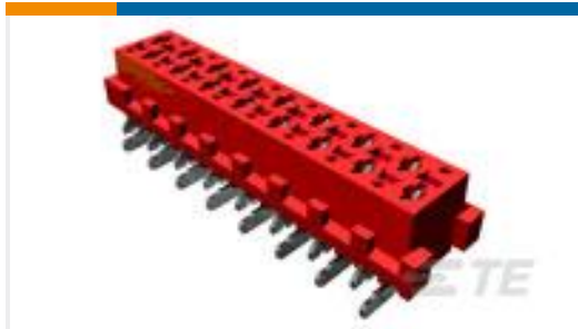
TE 产品编号8-188275-8 MICRO-MATCH SMD FTE