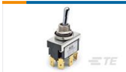
TE 产品编号7-6437630-2 AWTN1504 = POWER TOGGLE