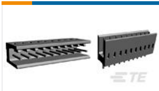
TE 产品编号826467-4 4P MOD II SHROUDED HEADER, ST