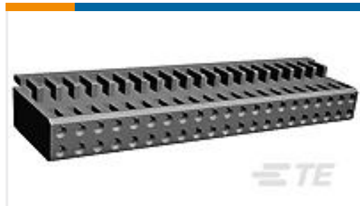
TE 产品编号926476-6 MOD 4 HSG