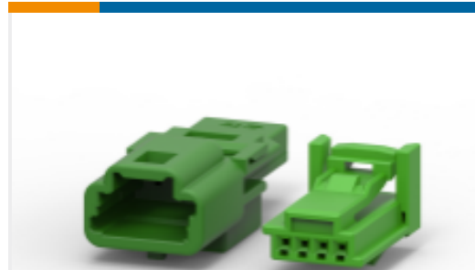
TE 产品编号1318756-2 TH/.025 连接器系统，壳体