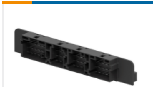
TE 产品编号1318750-2 High Pin Count Header