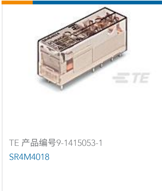
TE 产品编号9-1415053-1 SR4M4018