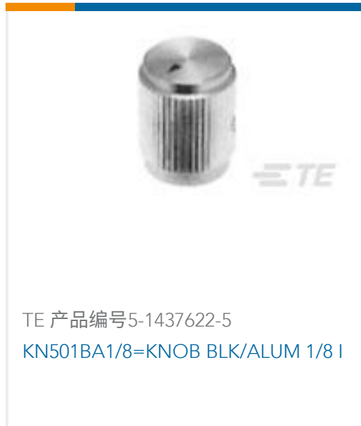
TE 产品编号5-1437622-5 KN501BA1/8=KNOB BLK/ALUM 1/8 I