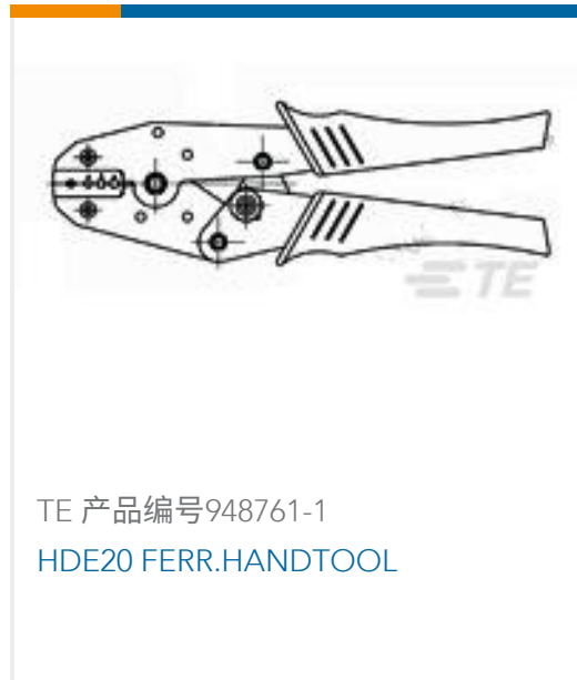
TE 产品编号948761-1 HDE20 FERR.HANDTOOL