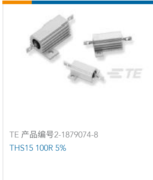
TE 产品编号2-1879074-8 THS15 100R 5%