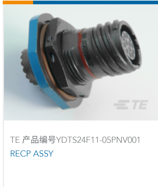
TE 产品编号YDTS24F11-05PNV001 RECP ASSY