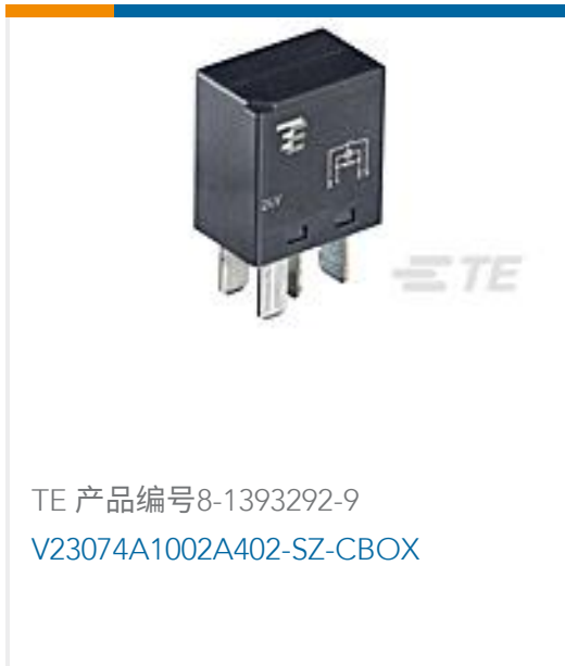
TE 产品编号8-1393292-9 V23074A1002A402-SZ-CBOX