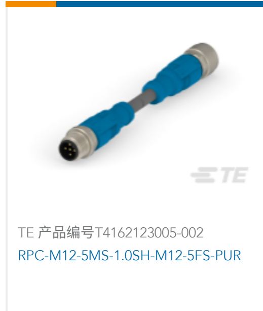
TE 产品编号T4162123005-002 RPC-M12-5MS-1.0SH-M12-5FS-PUR