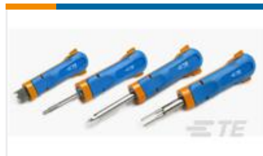
TE 产品编号539972-1 EXTRACTION TOOL