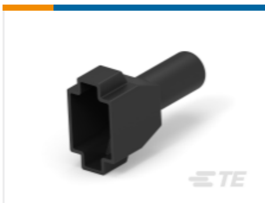
TE 产品编号DT8S-BT-BK BOOT, 8P, PLG, ST, BLK