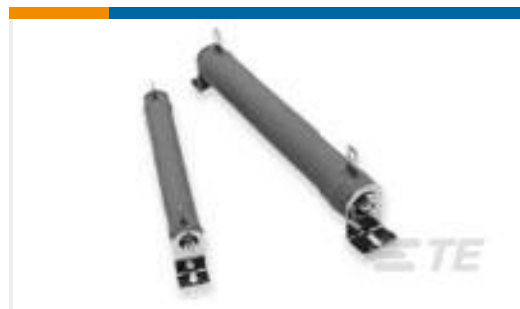
TE 产品编号1-1879453-4 TE 1000W 12R 5% Bracket