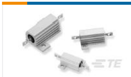
TE 产品编号2-1879074-3 THS15 50R 5%