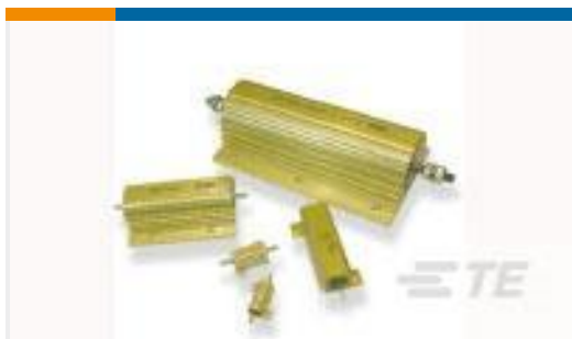
TE 产品编号1-1630027-0 HSC300 2R4 5%