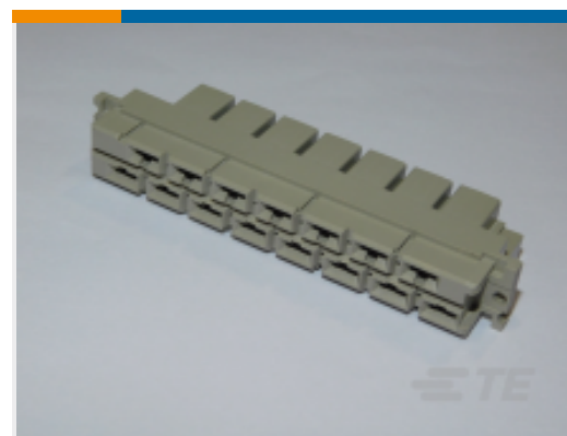
TE 产品编号928237-1 15P. TIMER HOUSING