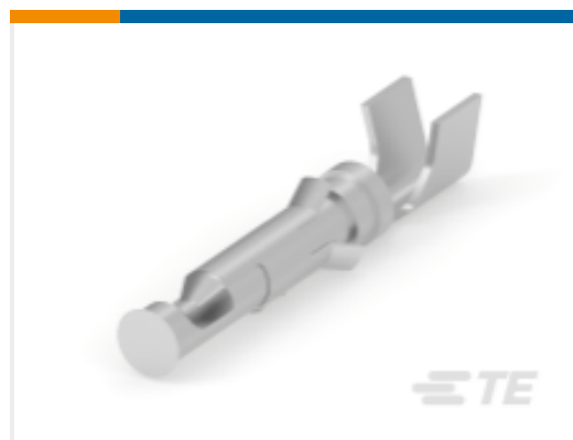
TE 产品编号965920-1 CI2 KONTAKTBUCHSE