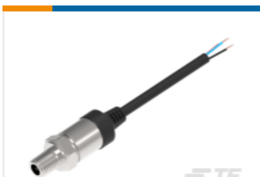
TE 产品编号20014203-12 PRESS XDCR M325M-000005-250PG