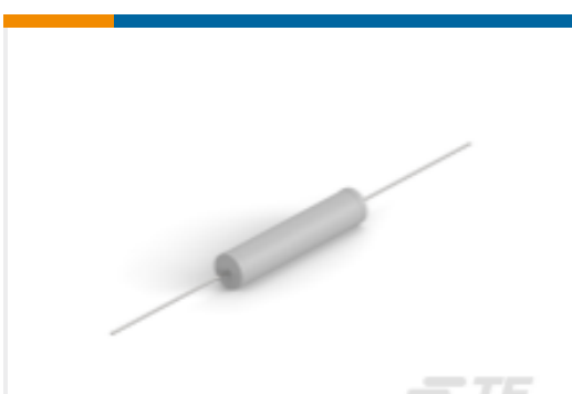
TE 产品编号9-2176415-0 8W STD M/OX 5% 150K