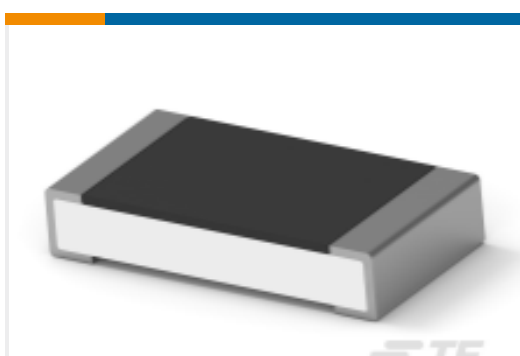
TE 产品编号1-2176391-0 RQ 1206 15K4 0.1% 10PPM 5K RL