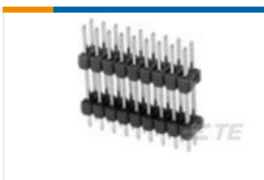
TE 产品编号5-146496-2 04 MODII HDR DRST UNSHRD STKG