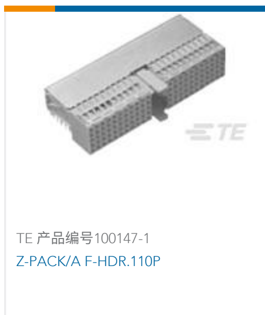
TE 产品编号100147-1 Z-PACK/A F-HDR.110P