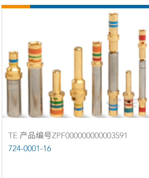
TE 产品编号ZPF000000000003591 724-0001-16