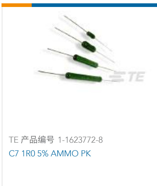
TE 产品编号 1-1623772-8 C7 1R0 5% AMMO PK