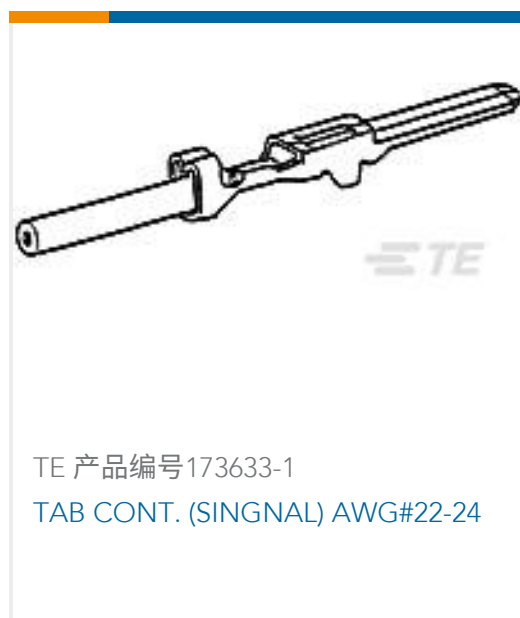
TE 产品编号173633-1 TAB CONT. (SIGNAL) AWG#22-24