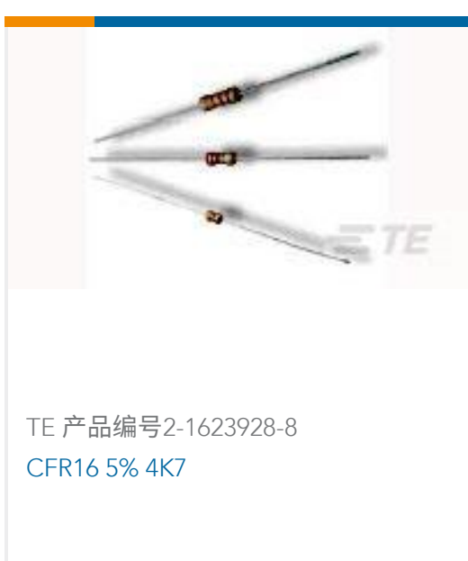
TE 产品编号2-1623928-8 CFR16 5% 4K7