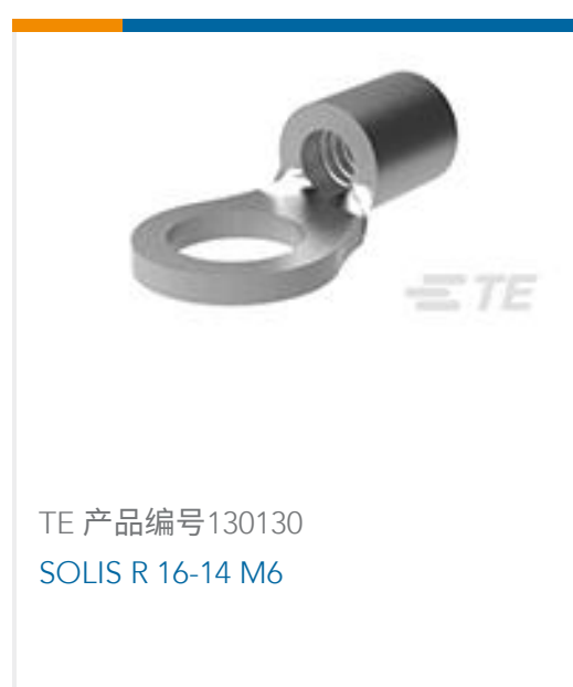
TE 产品编号130130 SOLIS R 16-14 M6