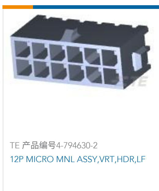
TE 产品编号4-794630-2 12P MICRO MNL ASSY,VRT,HDR,LF