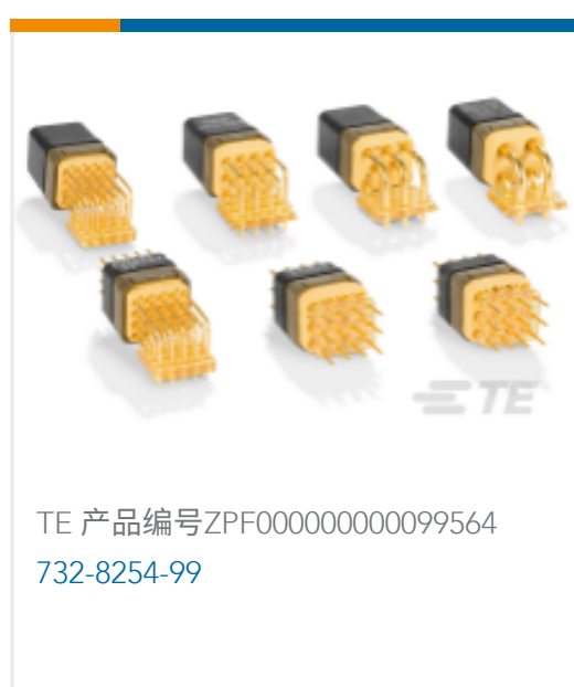
TE 产品编号ZPF0000000000099564 732-8254-99