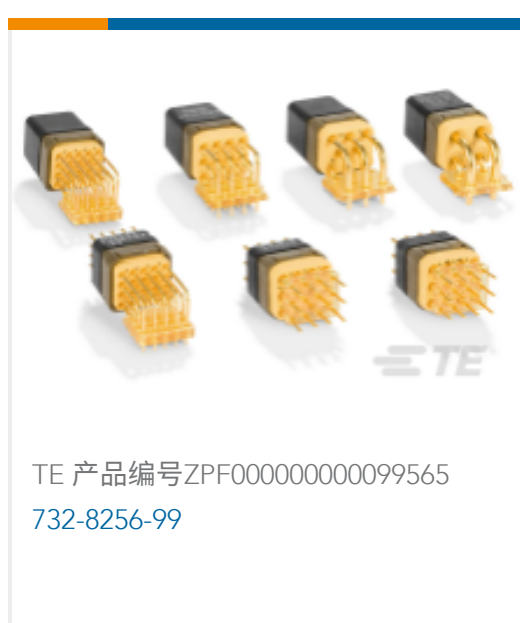
TE 产品编号ZPF0000000000099565 732-8256-99