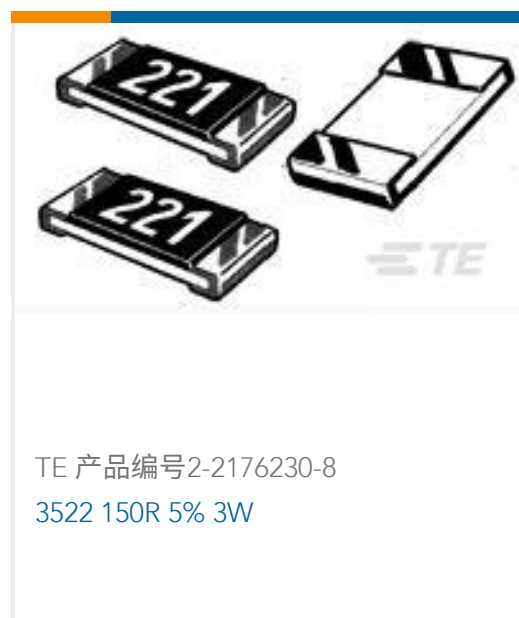
TE 产品编号2-2176230-8 3522 150R 5% 3W