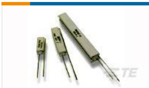
TE 产品编号1-1623733-0 SBCHE7 8K2 10%