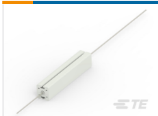
TE 产品编号2-1623729-0 线绕电阻器：垂直安装