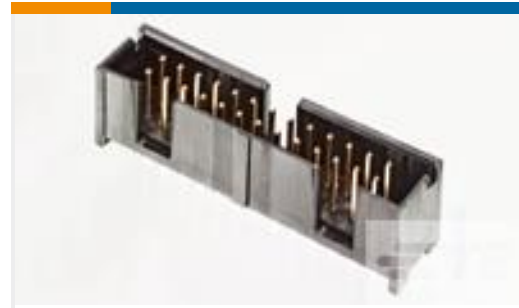
TE 产品编号5103308-3 A/L LOW PRO HDR 16P VERT BLACK