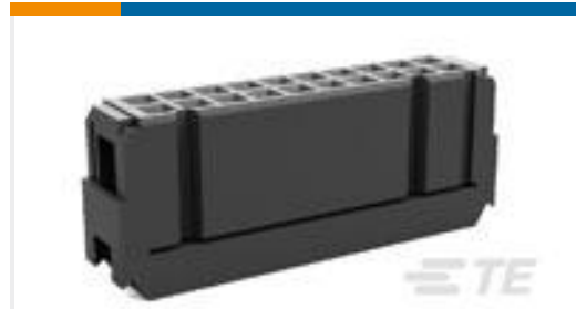
TE 产品编号1658620-1 10 NOVO MIL 15DP, LEAD FREE