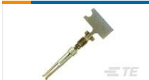
TE 产品编号1-66504-0 SOCKET CONTACT, 20 DF