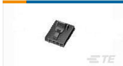
TE 产品编号1-104257-5 16 MTE RCPT HSG SR LATCH .100