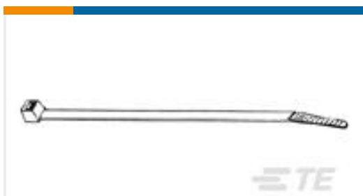
TE 产品编号2-604771-9 CABLE TIE, NATURAL, 4" (1000)